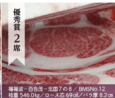
福福波-百合茂-北国7の8 / BMSNo.12 枝重 546.0kg / ロース芯 69cm / バラ厚 8.2cm